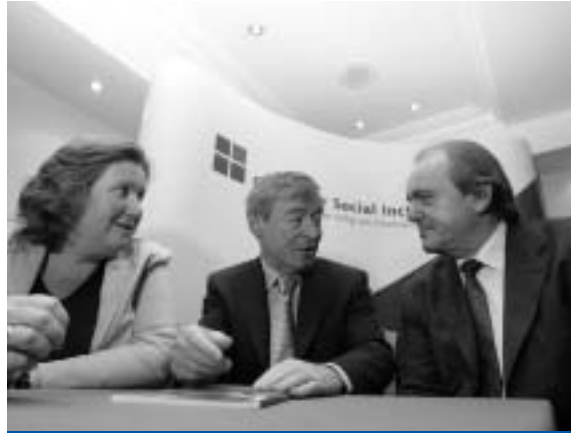
Seimineár comhairliúcháin don Phlean Gnímh Náisiúnta

Cuireadh tús i Meán Fómhair 2005 leis an bpróiseas comhairliúcháin do chéad Phlean Gnímh Náisiúnta eile na hÉireann in Aghaidh na Bochtaine agus an Eisiaimh Shóisialta (NAP/cuimsiú) 2006-2008, le fógraí sna nuachtáin agus sna meáin náisiúnta ag iarraidh ar eagraíochtaí agus ar bhaill den phobal aighneachtaí scríofa a chur isteach, maidir leis na cuspóirí agus na bearta polasaí ginearálta a luafaí sa Phlean. Chuir an OSI treoirínte, maidir le hullmhú aighneachtaí, ar fáil. Úsáideadh suíomh idirlín OSI – www.socialinclusion.ie – chun cuireadh a chur amach, ag iarraidh aighneachtaí.