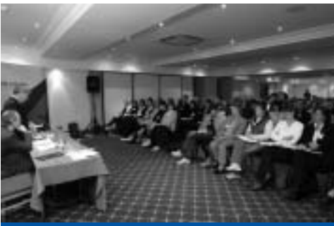
Seimineár comhairliúcháin don Phlean Gnímh Náisiúnta

NAP/cuimsiú, mar aon leis na daoine a bhíonn ag obair leo. 512 líon na ndaoine ar fud na tíre a d’fhreastal ar na seimineáir.