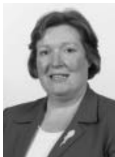
Orlaigh Quinn Príomhoifigeach